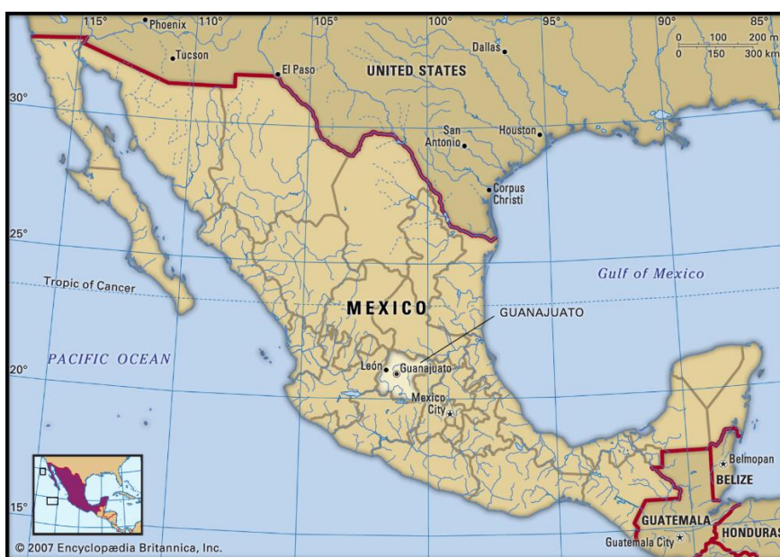
Figura 1. Mapa de localización.

En Guanajuato, se cuenta con una colección de Momias humanas que despiertan el interés, de visitantes nacionales, que son cerca del 97% de sus visitantes totales (siendo solamente un 3% de visitantes internacionales) reunidos en un museo de propiedad municipal que recibe a más de 550.000 visitantes anuales (Ruiz Lanuza, 2011). Esta ciudad ha despertado el interés en la agenda política del Estado, en el que una de las principales preocupaciones se centra en reconocer la VT de sus municipios como elemento inicial para la planificación del destino.