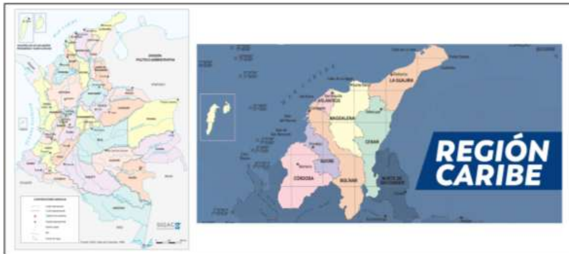
Figura 1. Ubicación de la región Caribe colombiana.

Fuente: adaptado de Instituto Geográfico Agustín Codazzi [IGAC] (s.f.) y Ministerio de Tecnologías de la Información y las Comunicaciones de Colombia (2019).